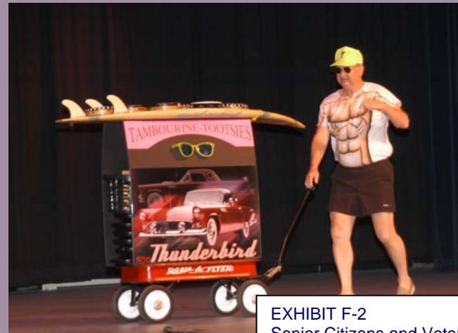
EXHIBIT F-2 Senior Citizens and Veterans A.C.R. 35) Document consists of 56 pages. Entire exhibit provided. Meeting Date: 5-7-08